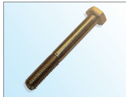
Fig. 2: Tornillo OE

En el marco del desarrollo continuo de nuestros productos y de la seguridad de la calidad INA suministra con la polea tensora 531 0342 30 un nuevo tornillo (fig. 3).