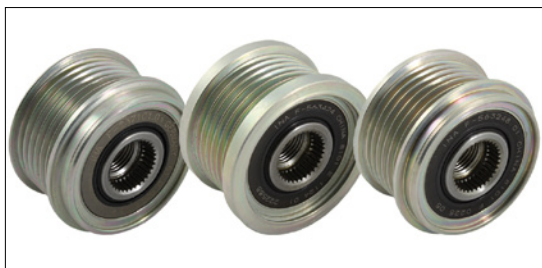
Figura 2: Poleas libres de alternador 535 0063 10 (izquierda), 535 0202 10 (centro), 535 0203 10 (derecha)

La polea libre desacopla el accionamiento de agregados de las irregularidades rotacionales del motor y se encarga de un funcionamiento más uniforme y silencioso de la polea acanalada. Con ello se consigue un funcionamiento más silencioso y agradable del motor.